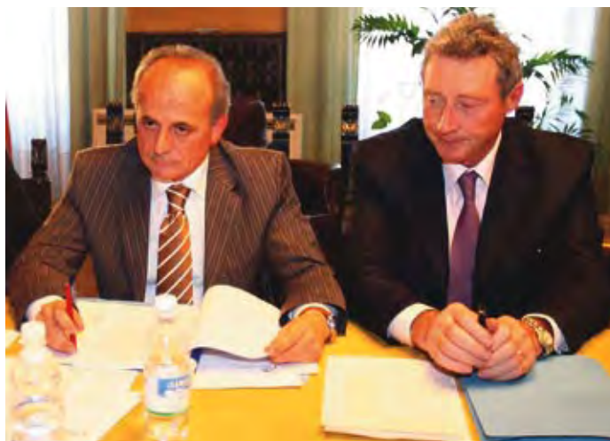
Il Presidente della Provincia Vittorio Casarin e il Presidente di Turismo Padova Terme Eugane Ubaldo Lonardi durante l'insediamento del nuovo Consiglio di Amministrazione dell'Azienda Turismo.

A tal proposito ha proposto un incontro tra i membri del CdA e del Tavolo Strategico con l'attuale Assessore al Turismo nonché vice presidente della Giunta Regionale Luca Zaia , per confrontarsi sulle opportunità che ci sono per il settore, per evidenziare le esigenze e gli sforzi che si stanno facendo nel territorio e sollecitare quindi una maggiore attenzione per il turismo padovano e provinciale. Riconoscendo il grande esempio di collaborazione e la maturità dimostrate dal Tavolo Strategico nel superamento della frammentazione esistente nel settore turistico, il Presidente Casarin ha espresso l'opportunità di reperire altre risorse pubbliche e private per rendere il progetto stesso più incisivo.