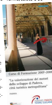
Corso di Formazione 2007-2008

Alla conclusione del corso è stato rilasciato un attestato di partecipazione. I due corsi sono stati molto frequentati ed hanno avuto un buon successo.